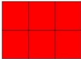
Artículo tipo 1