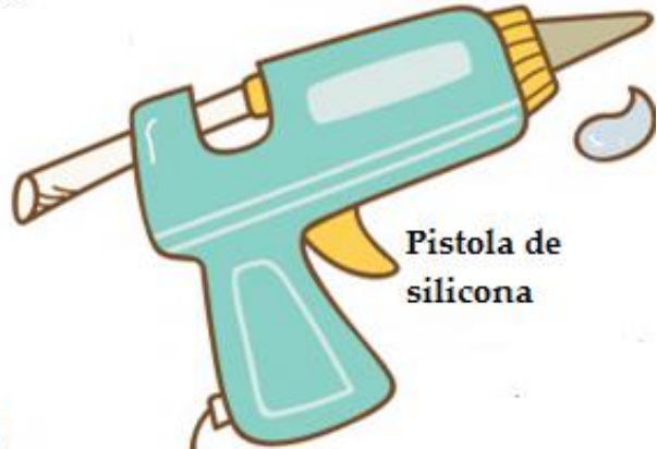
Pistola de silicona