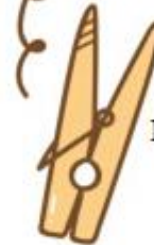
Perro de ropa